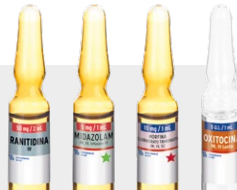
REGULAR PSICOTRÓPICO ALTO RIESGO ESTUPEFACIENTE ALTO RIESGO ALTO RIESGO